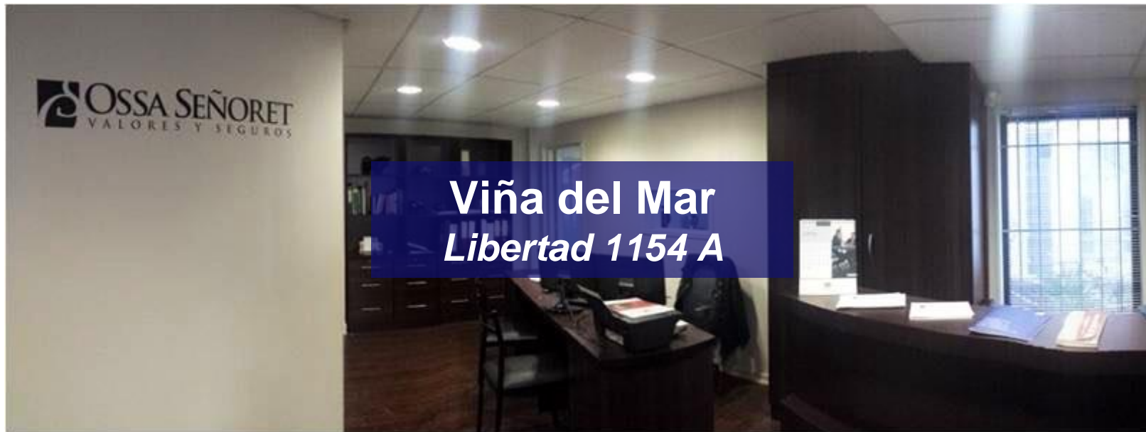
Viña del Mar Libertad 1154 A