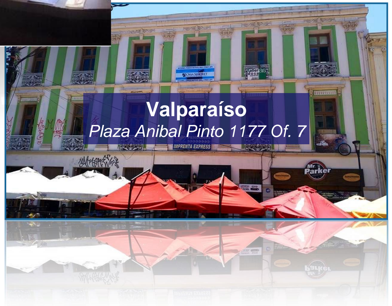
Valparaíso Plaza Anibal Pinto 1177 Of. 7